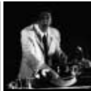
Michel Risse compositeur