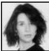
Gaëlle Hoven chanteuse